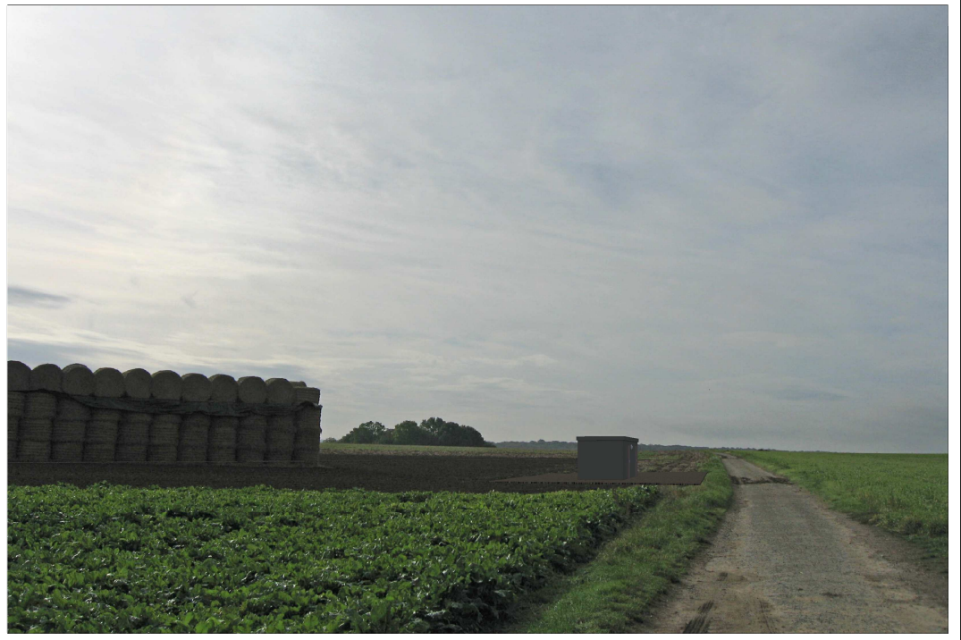
Poste de livraison n°2 : Vue après implantation