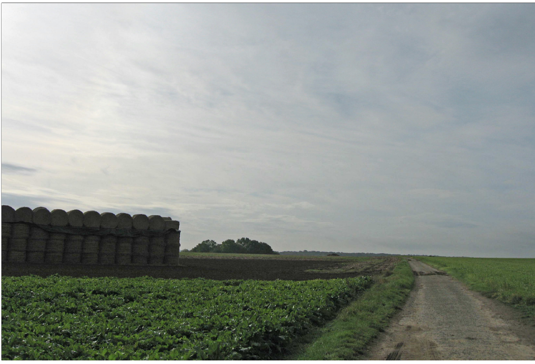
Poste de livraison n°2 : Vue avant implantation